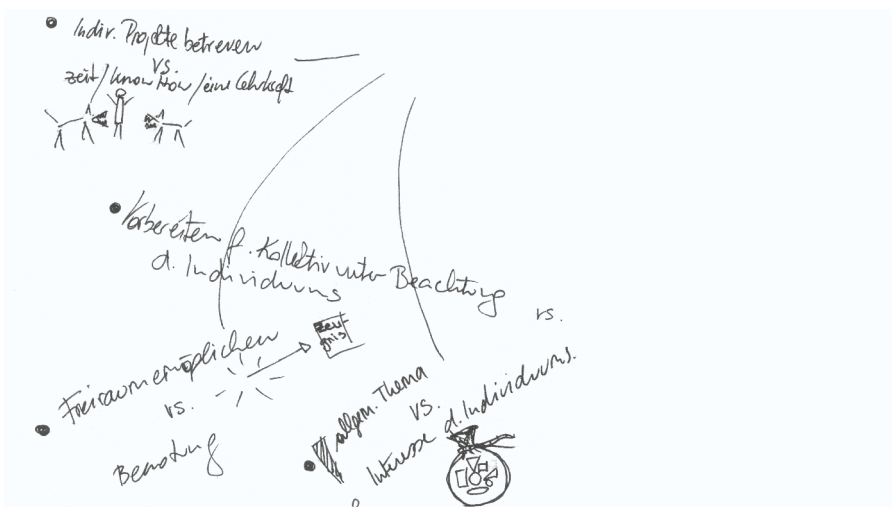
SV Karte: Differenzen und Widersprüche im pädagogischen Handeln, Karte 10, Ausschnitt 1

Im Kartenmaterial finden sich weitere Facetten des Spannungsverhältnisses zwischen und in den drei Handlungsanforderungen soziale Vermittlung , didaktische Vermittlung und Vermittlung institutioneller Strukturen , die auch gleichzeitig als Spannungen im Selbstverständnis des_der Verfasser_in der Karten gelesen werden können: