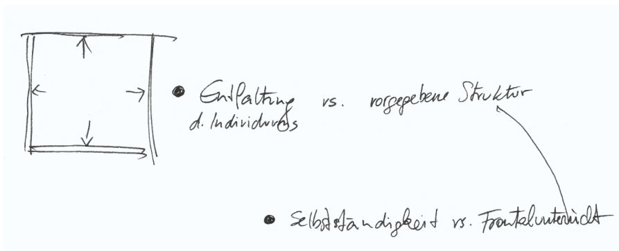
SV Karte: Differenzen und Widersprüche im pädagogischen Handeln, Karte 10, Ausschnitt 2

Zeit-, Wissens- und Personalressourcen, die institutionell vorgegeben sind, kollidieren mit dem didaktischen Anspruch der individuellen (Projekt-)Betreuung. Umgekehrt steht der didaktische Wunsch »Freiräume zu ermöglichen« der Vermittlung der institutionellen Struktur entgegen, die sich letztlich in der Vergabe von Noten äußert. Zudem stehen Pädagog_innen der didaktischen Anforderung gegenüber, das »allgemeine Thema« mit dem »Interesse« des »Individuums« in einen »Sack zu packen«, ein Anspruch der in sich widersprüchlich ist. Des Weiteren sollen Kinder durch die soziale Handlungsanforderung für das »Kollektiv unter Beachtung des Individuums« vorbereitet werden. Die didaktische und soziale Anforderung der »Entfaltung des Individuums« steht letztlich auch im Widerspruch zur institutionellen Struktur – in Bezug zur Unterrichtsform: »Selbstständigkeit vs. Frontalunterricht« – da beispielsweise Bildungsinstitutionen oftmals architektonisch auf »Frontalunterricht« ausgelegt sind.