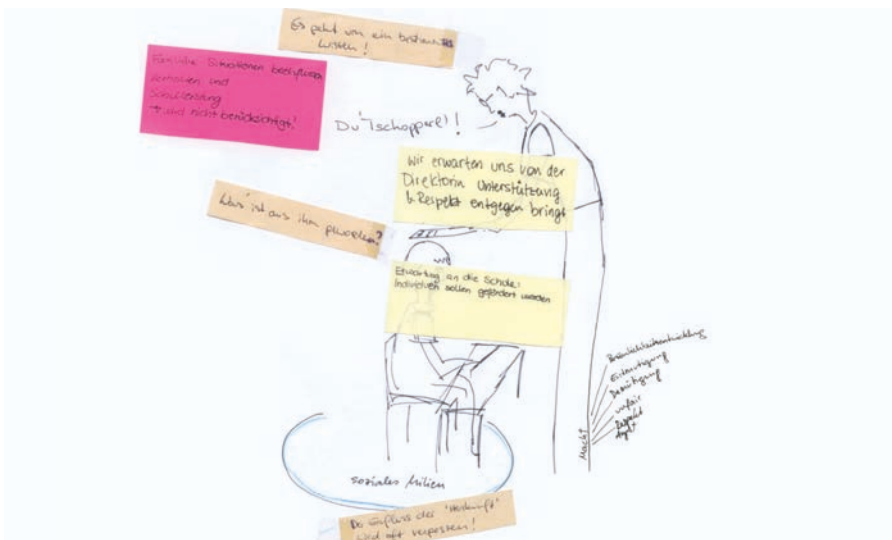
SV Karte mit zwei Seiten: als Edukand_in und als Edukatorin, Karte 5: 1, Ausschnitt

sozial diskriminierende Differenzen durch soziale Vermittlung in pädagogischen Situationen ausgleichen zu können, ist ein sehr hoher und kaum für das gesamte institutionelle Setting erfüllbar.